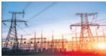
వచ్చని కమిషన్ అనుమతించింది.

సాక్షి, అమరావతి: రాష్ట్రంలో పవర్ హబ్బిలే లేదని, పరిశ్రమలకు విద్యుత్ సరఫరాపై ఎలాంటి పరిమితులు అమలు చేయడం లేదని రాష్ట్ర విద్యుత్ పంపిణీ సంస్థలు సోమవారం ప్రకటించాయి. విద్యుత్ డిమాండ్ కు అనుగుణంగా సరఫరా పరిస్థితి మెరుగుపడినందున పరిశ్రమలకు పరిమితులు ఎత్తివేయాలని నిర్ణయించినట్లు తెలిపాయి. రాష్ట్రంలో ఆదివారం అన్ని రంగాలకు ఎలాంటి కోతలు, పరిమితులు లేకుండా నిరంతరాయంగా విద్యుత్ సరఫరా చేసినట్లు వివరించాయి. ఆదివారం రాష్ట్రంలో మొత్తం 206.5 మిలియన్ యూనిట్లు విద్యుత్ సరఫరా చేశాయి. రాష్ట్ర వ్యాప్తంగా ఎక్కడా సరఫరాలో ఎలాంటి అంతరాయాలుగానీ, లోడ్ షెడింగ్ గానీ లేదు. సెప్టెంబర్ 1న రాష్ట్రంలో నెల కొన్న గ్రాడ్ డిమాండ్-సరఫరా పరిస్థితులను బట్టి పారిశ్రామిక రంగానికి కొద్దిగా విద్యుత్ సరఫరా తగ్గింది. ప్రాధాన్యతా రంగాలైన గృహ, వ్యవసాయ రంగాలకు అంతరాయాలు లేకుండా విద్యుత్ సరఫరా చేశాయి. విద్యుత్ డిమాండ్ ఎక్కువగా ఉన్నప్పుడు పరిశ్రమలకు కొంతమేరకు సరఫరా తగ్గింది వ్యవసాయ, గృహ వినియోగదారులకు పూర్తిస్థాయిలో సరఫరా చేస్తామని ఆంధ్రప్రదేశ్ విద్యుత్ నియంత్రణ మండలి (ఏపీఈఆర్టీ)కి విద్యుత్ పంపిణీ సంస్థలు అభ్యర్థన పంపించాయి. ఆ అభ్యర్థన మేరకు ఈనెల 5 నుంచి రాష్ట్రంలో పారిశ్రామిక రంగానికి స్వల్పంగా విద్యుత్ పరిమితులు విధించ