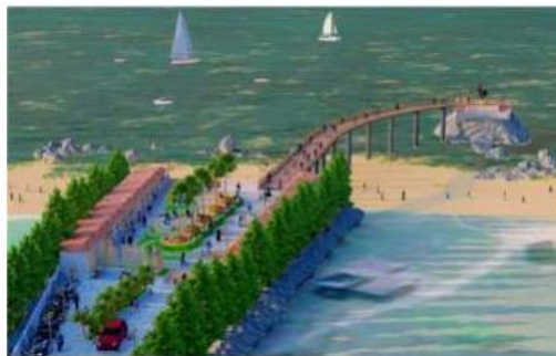
An artist's impression of Ocean Deck project proposed in Visakhapatnam.

A feasibility study report with detailed architectural drawings has been submitted by Andhra Pradesh Urban Infrastructure Asset Management Limited (APUIAML), and the VMRDA has plans to set up the Ocean Deck near the YSR Statue Junction at an estimated cost of ₹7.8 crore. At present, only Mumbai has one such tourist facility. However, it is a