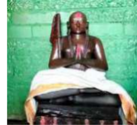
The ancient statue of Saint Sri Ramanuja, dating back to the 15th century, installed in

The Ramanuja statue is called by the locals as 'Emberu Swamy', roughly sounding similar to the