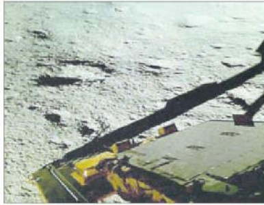
ఆగస్ట్ 25న ల్యాండ్లింగ్ చంద్రుడిపై దిగిన చోటు

సూర్యుడుపేట(తిరుపతి జిల్లా): చంద్రయాన్-3 మిషన్ ప్రయోగం విజయవంతంగా కొనసాగుతోంది. జాబిల్లి దక్షిణ ద్రువం ఉపరితలంపై ల్యాండ్లింగ్ 'విక్రమ్'ను మరోసారి సాఫ్ట్ ల్యాండ్లింగ్ చేశారు. మొదట దిగిన ప్రాంతంలో కాకుండా మరో చోట విక్రమ్ క్షేమంగా దిగినట్లు భారత అంతరిక్ష పరిశోధన సంస్థ(ఇస్రో) 'ఎక్స్'లో వెల్లడించింది. తాము ఇచ్చిన ఆదేశాలకు విక్రమ్ చురుగ్గా స్పందించిన్నట్లు తెలియజేసింది. ల్యాండ్లింగ్ తొలిసారిగా ఆగస్టు 23న చంద్రమామ ఉపరితలంపై విజయవంతంగా దిగిన సంగతి తెలిసిందే. చంద్రయాన్-3 మిషన్ లక్ష్యం లో భాగంగా ల్యాండ్లింగ్ను తాజాగా మరోచోట దించారు. కమాండ్ ఇచ్చిన తర్వాత ల్యాండ్లింగ్ని ఇంజిన్లు పైకి అయ్యాయని, తర్వాత ల్యాండ్లింగ్ 40 సెంటీమీటర్ల మేర పైకి లేచిందని, 30 నుంచి 40 సెంటీమీటర్ల దూరంలో సురక్షితంగా ఉపరితలంపై దిగిందని ఇస్రో స్పష్టం చేసింది. ఈ ప్రక్రియ మానవ సహిత ప్రయోగాలను నిర్వహించే