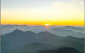
అందాల్లో అత్యంత ఎత్తయిన ముకుంపేట మండలంలోని ఆర్మీ (సీతమ్మ) కొండ ఉత్తములు జారీ చేశారు. ఏవీ టూరిజం ఆఫీసర్ తో పాటు ప్రభుత్వంవే స్థాపించబడిన అడ్వెంచర్ స్పోర్ట్స్ ఆకాడమీ ద్వారా కెల్లివింగ్, లాజిస్టిక్స్ ను పూర్ణ పుష్కల ఇస్తోంది. సోమవారం ఉదయం ఈ యాత్ర ప్రారంభమవుతుంది. హుకుంపేటలో ముందుగా పోలీస్, రెవెన్యూ శాఖల ఆధ్వర్యంలో సమావేశం నిర్వహిస్తారు. ఆనంతరం తిగవలస-కడి